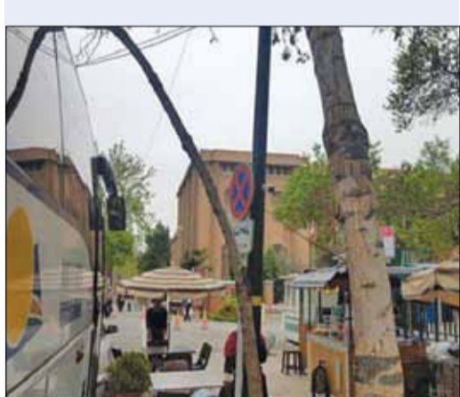
کافه‌های سیار، در خیابان سی تیر، همانند خیابان‌های اروپایی در حال سرویس دهی به گردشگران و شهروندان تهران هستند.