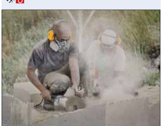
هشتمین سمپوزیوم مجسمه سازی تهران، با حضور هنرمندان بین‌المللی و ایرانی این روزها در برج میلاد در حال برگزاری است. هنرمندان برای جلوگیری از ورود ذرات سنگ به چشم و دستگاه تنفسی، از ماسک و عینک‌های مخصوص استفاده می‌کنند.