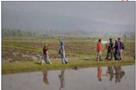
فیلم مستند «شاعران زندگی» به کارگردانی شیرین برق‌نورد در جشنواره بین‌المللی فیلم سبز سنول روی پرده می‌رود. این جشنواره با موضوع محیط زیست در تهران برگزار می‌شود.